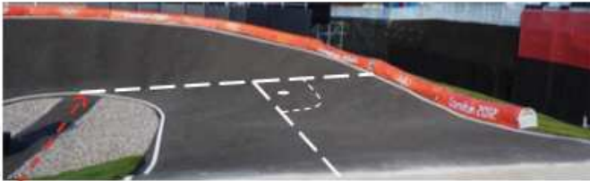
Bottom line and Inner radius